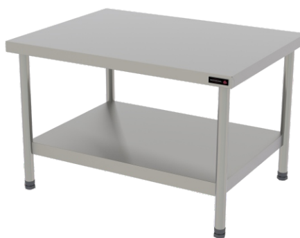
PRO CAVALETE 90