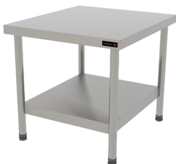
PRO CAVALETE 60