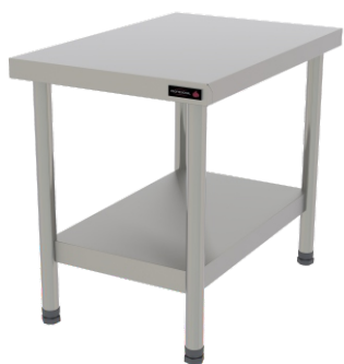
PRO CAVALETE 45