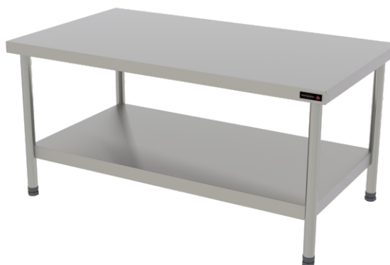
PRO CAVALETE 120